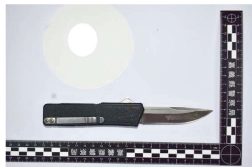
圖 12、 家豪持有彈簧刀情形，刀刃十分鋒利！

本案 113 年 7 月 5 日由國民法官參審第一審宣判，依傷害致人於死罪判家豪 10 年 6 月徒刑，又犯傷害罪處 2 年徒刑。對於鑑識人員來說，刑案現場的物證是起點，但周邊數位證物亦不可輕視，沉默的目擊者能幫助我們還原案發經過，另外在現今科技資訊發達的年代，手機已是每個人的貼身助理，記錄所有動態訊息，甚至是犯案影像等，只要不放過每一個蛛絲馬跡，那些看似平凡、瑣碎的細節必定能在關鍵時刻發揮最大的功用！FACT