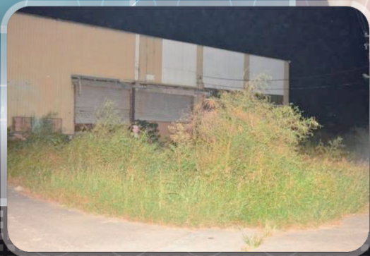
圖2、現場倉庫外觀情形