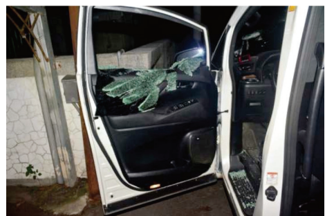
圖6、廂型車駕駛座車門玻璃破裂情形