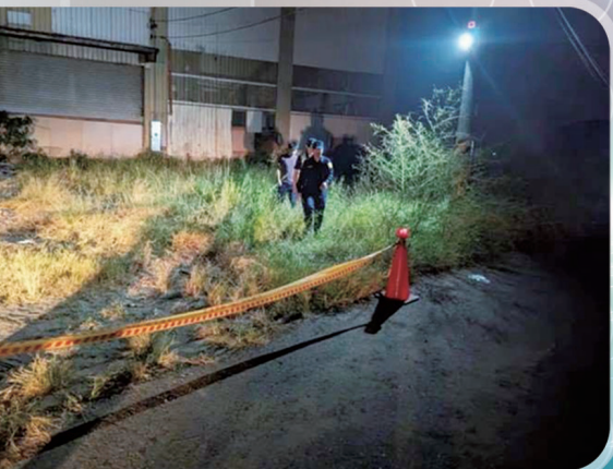
圖1、現場封鎖採證情形

時值秋季，正是家家戶戶沉浸在豐收喜悅的美好時刻，一場慘劇卻發生在嘉義縣某個偏僻的鐵皮倉庫中。