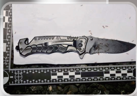
圖3、現場發現兇刀！刀鋒沾染血跡，吸引大量螞蟻附著

前往現場的路上，我們一路從明亮的道路開到連路燈都沒有的昏暗小徑，從平坦寬敞的柏油馬路開到崎嶇狹窄的產業道路，正當我們開始懷疑前進的方向是不是正確時，終於看見派出所同事巡邏車的警示燈，也能隱約看見事發那間鐵皮倉庫，倉庫前的空地已經圍起封鎖線（如圖1），封鎖線外圍也聚集不少同事，所幸現場位置偏僻、人跡罕至，比較不會有民眾誤闖破壞現場的疑慮。將勘察車停妥後，鑑識人員迅速分工，我們依序分區檢視現場情形，但因為抵達現場時夜色已深，現場燈光除了一盞昏暗的路燈，就只剩下巡邏車的大燈以及勘察人員手上的手電筒，而且倉庫前方的泥土地長滿許多雜草（如圖2），勘察過程十分艱辛，但經過仔細勘察，我們在現場發現斷裂的高爾夫球桿握把、連著車窗隔熱紙的玻璃碎片、斷裂的木棍、防狼噴霧、1把帶血的黑色摺疊刀（如圖3），以及幾處怵目驚心的血跡（如圖4）。鮮紅的血跡告訴我們這裡就是衝突發生的地點，但現場遺落的高爾夫球握把缺少桿頭，現場及刀刃上血跡不知是誰留下，至此，仍有許多謎團尚未解開。