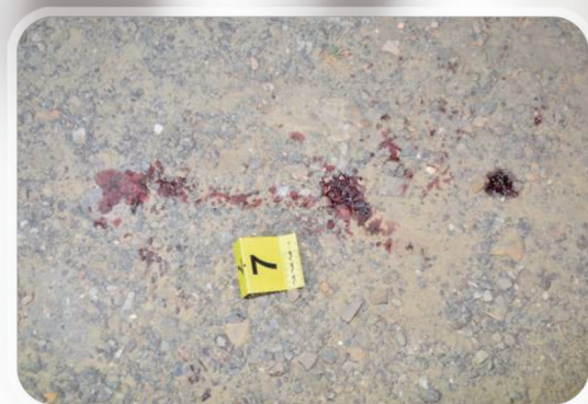
圖4、現場血跡令人觸目驚心